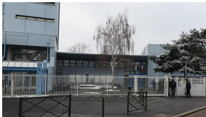
Vue du lycée Jean Jaurès à ARGENTEUIL (95)