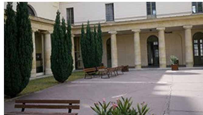
Cour du lycée Condorcet à PARIS (75)

Les 36 lycées franciliens concernés par cet accord-cadre sont des ERP d'environ 10 000 m 2 chacun, répartis sur différents niveaux selon les établissements. Accueillant chaque jour de nombreux lycéens, ces établissements doivent satisfaire aux exigences réglementaires. Ainsi de multiples opérations de réhabilitation et de remise aux normes de ces établissements sont nécessaires tels que la mise aux normes d'accessibilité des sanitaires, des escaliers, des ascenseurs, des menuiseries extérieures et une rénovation des logements de fonction.