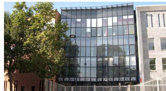
Vue du lycée René Auffray à CLICHY (92)