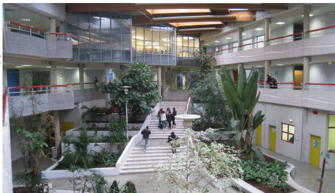
Hall d'entrée du lycée Paul Robert aux LILAS (93)

maître D'ouvrage LOCALISATION MISSION maîtrise D'oeuvre SURFACE BUDGET CALENDRIER Région Île-de-France Île-de-France Construction Durable Île de France Mise en accessibilité handicap de 12 lycées franciliens, Lot 01 AR ARCHITECTES, VERDI Bâtiment Cœurde France, GAYET SSI, Phoenix DB, ASCAUDIT 10 000m 2 env/établissement 3 500 000 € HT Réception des travaux en 2019