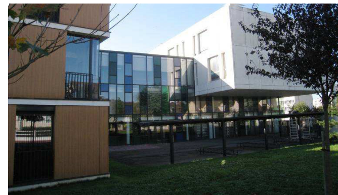
Vue du lycée Louis Armand à EAUBONNE (95)