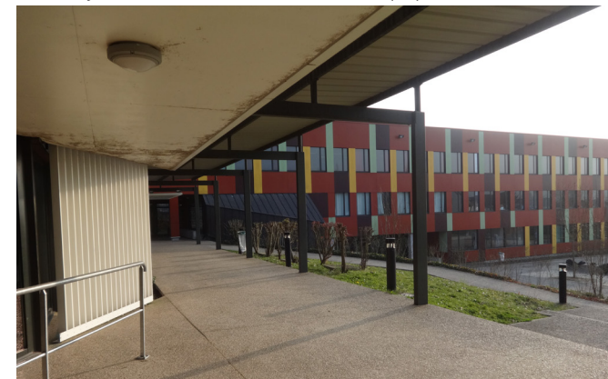
Lycée Samuel Beckett à LA FERTE-SOUS-JOUARRE (77)