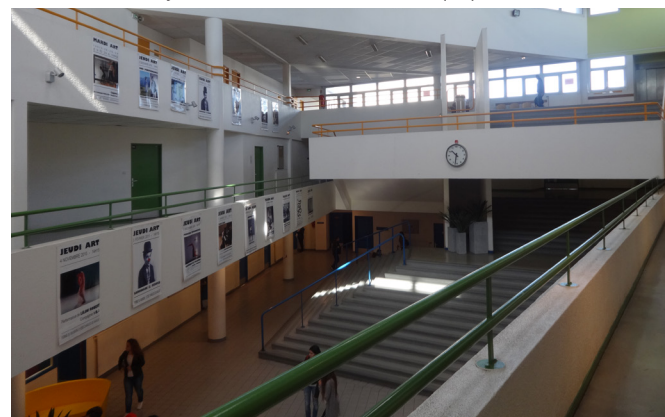
Hall d'entrée du lycée Charles de Gaulle ROSNY SOUS BOIS (93)