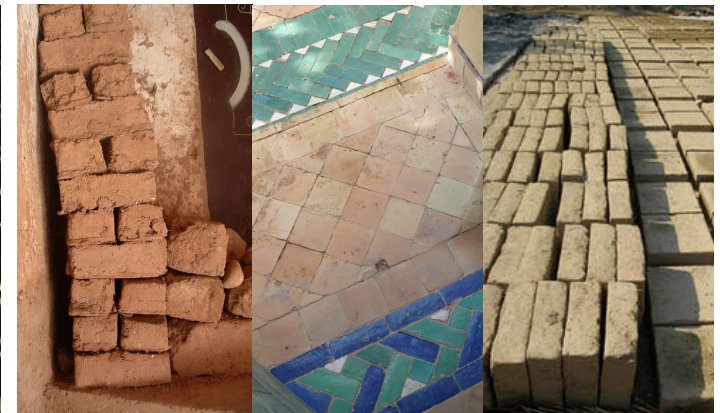
Le Pisé , le Bejmat et la terre crue