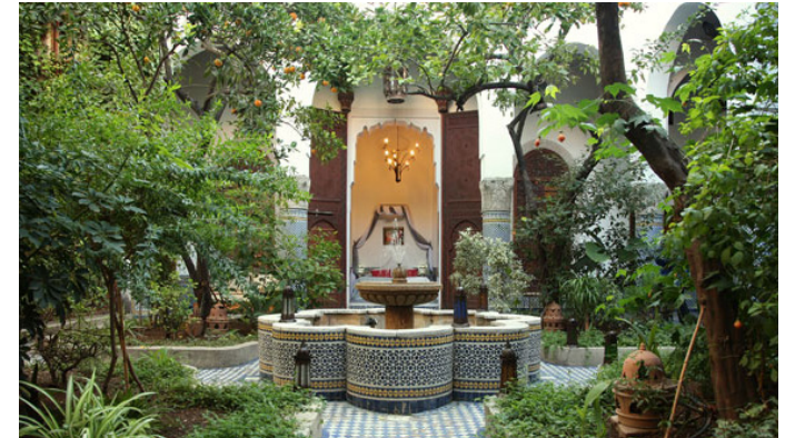
Patio rafraichissant qui participe au confort thermique