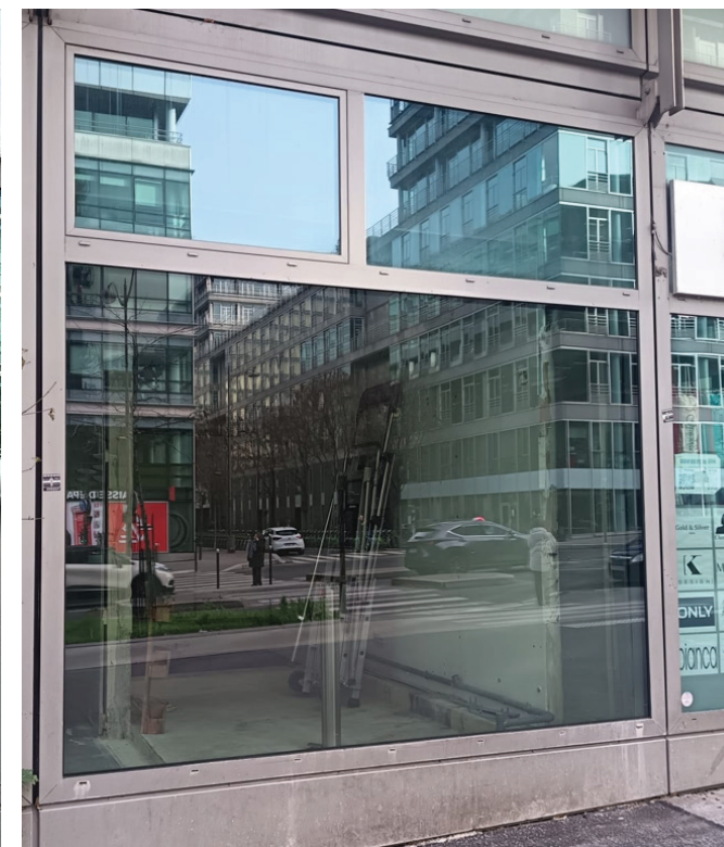
Remplacement de la fontaine par du vitrage - Travaux réalisés

Eau de Paris, quittant le bâtiment Rue Neuve Tolbiac, afin de s'installer dans son nouveau siège social, le projet consistait à restaurer la façade à l'état initial . Pour cela, les travaux comprenaient la dépose de la fontaine d'eau potable publique et la mise en oeuvre d'un vitrage identique au vitrage existant . L'aménagement intérieur constituant une contrainte pour l'installation du double vitrage, des travaux de démolition ont été mis en oeuvre. Enfin, les études ont également portées sur la dépose de deux enseignes "Eau de Paris" situées sur les deux façades sur rue.