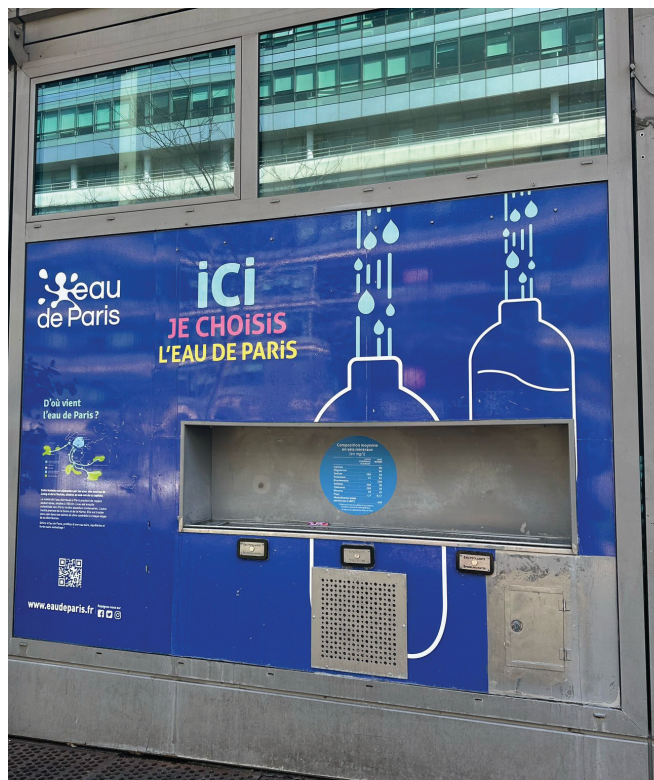
Fontaine de la façade du siège d'Eau de Paris - Etat existant